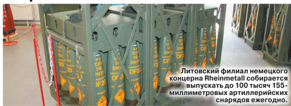
Литовский филиал немецкого концерна Rheinmetall собирает выпускать до 100 тысяч 155-миллиметровых артиллерийских снарядов ежегодно.

В Прибалтике спешно строят завод по выпуску боеприпасов