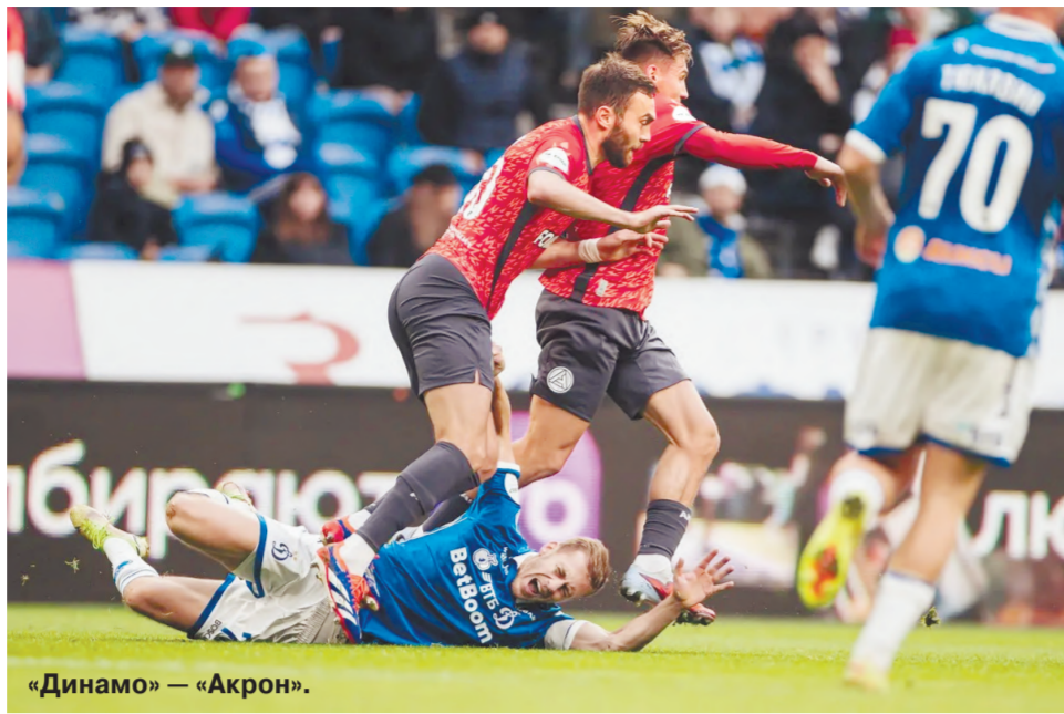
«Динамо» — «Акрон».