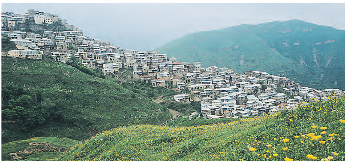
2024 год. Старая часть аула Кубачи Дахадаевского района, одного из крупнейших на Кавказе традиционных центров художественной обработки металла