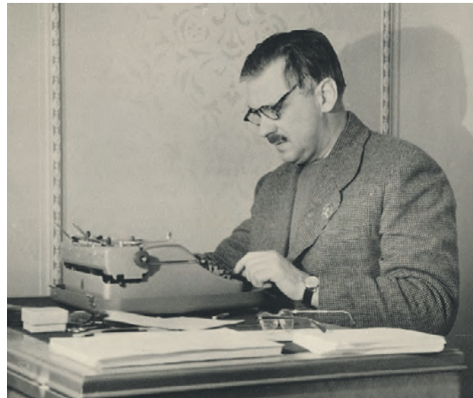
Сергей Михалков в 1957 году. Две из четырех поэм о Дяде Степе к этому времени уже опубликованы