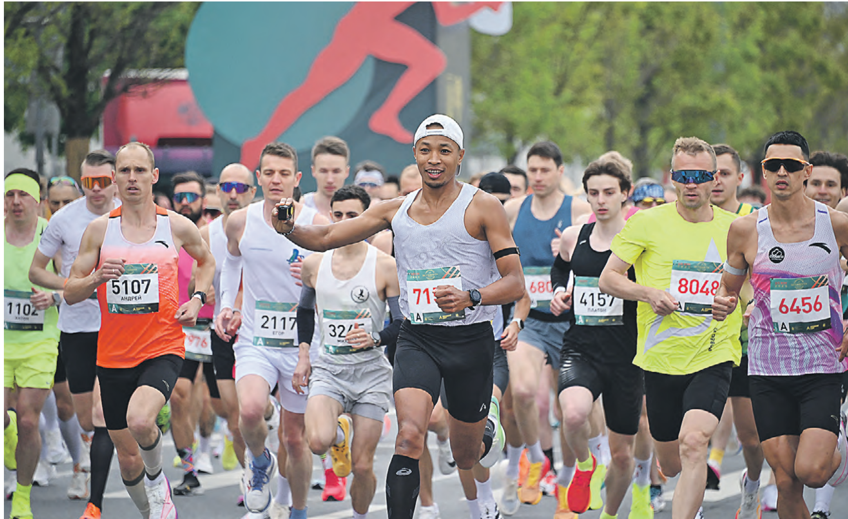
17 мая. Участники массового забега и легкоатлетической эстафеты пробежали по Садовому кольцу. Круговой маршрут протяженностью 15 километров проходил по живописным местам столицы. В мероприятии приняли участие около 10 тысяч человек. Забеги пройдут и в рамках других праздников спорта.

— В «Лужниках» состоится «Киберзарница», — продолжил Сергей Собянин. — Участники испытают силы